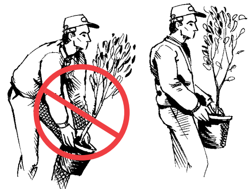
No se doble desde la cintura cuando levanta un objeto.