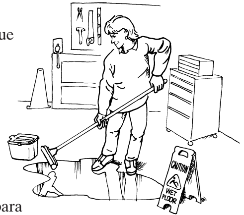
Algunos peligros, como pisos mojados y resbalosos, se pueden eliminar de inmediato.