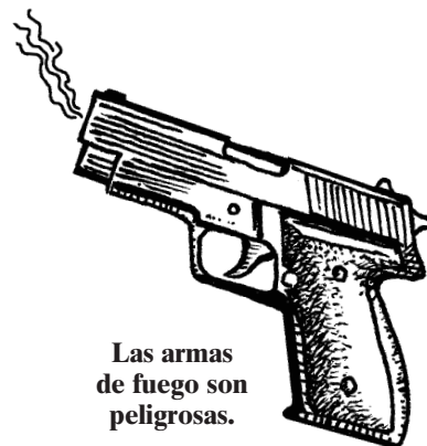
Las armas de fuego son peligrosas.

Nota al instructor: Siga este texto o úselo como guía para conducir sesiones de entrenamiento de "tailgate" de 10 a 15 minutos con sus trabajadores agrícolas/horticultura. Usted puede fotocopiar esta hoja para que la usen sus empleados. Sin embargo, tenga presente que no se puede publicar ni vender. Insista en que no se permite la presencia de armas de fuego en el lugar de trabajo. Esta hoja de consejos prácticos está diseñada principalmente para que los empleados que tienen armas las manejen, usen, y almacenen de manera segura fuera de nuestras instalaciones.