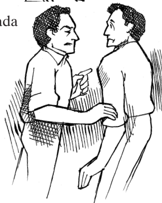
El acoso puede darse de un varón a otro.