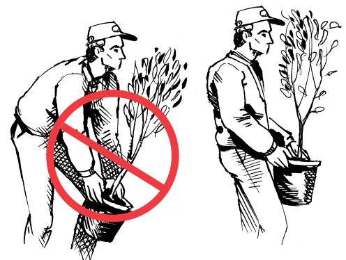
No se doble desde la cintura cuando levanta un objeto.