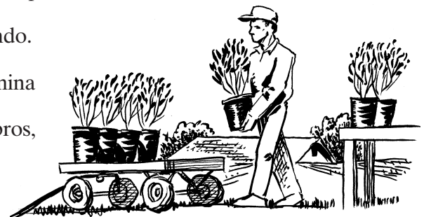
Siempre use una postura correcta cuando transporta objetos.