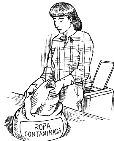
Mantenga la ropa contaminada con pesticidas separada de la otra ropa.