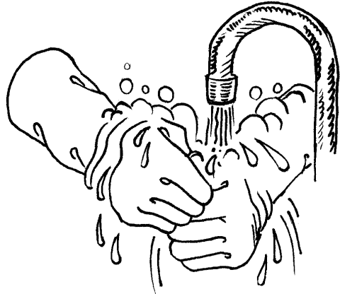
Lave la parte externa de sus guantes con agua y jabón