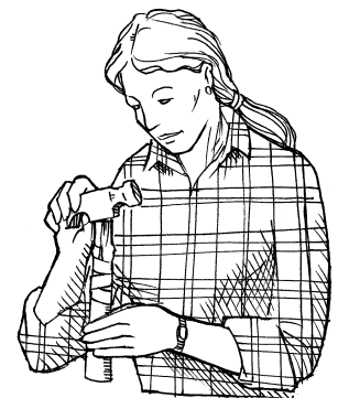
No use herramientas dañadas.