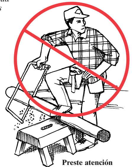
Preste atención cuando use herramientas de mano.