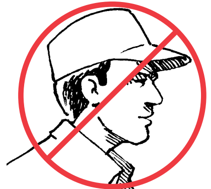
Un gorro de béisbol solo no le protegerá bien contra el sol.

Advertencia: Un gorro de béisbol solo no le protegerá bien contra el sol. Si decide usar un gorro de béisbol, úselo con un pañuelo en el cuello, o busque uno que tenga una aleta protectora contra el sol que le proteja, además de la cara, la parte de atrás del cuello y las orejas.