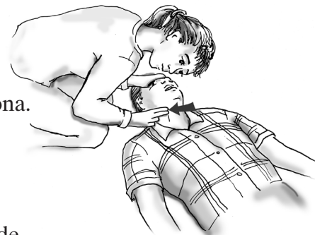
Mire, escuche y sienta si hay respiración.

Nota al instructor: Respire profundo y demuestre como sube y baja el pecho al respirar. Después pida a los participantes que respiren profundo unas cuantas veces.