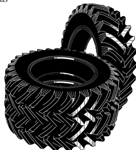
Preocúpese de que no se acumule agua en las llantas que están guardadas ya que puede ser una fuente de reproducción de mosquitos.