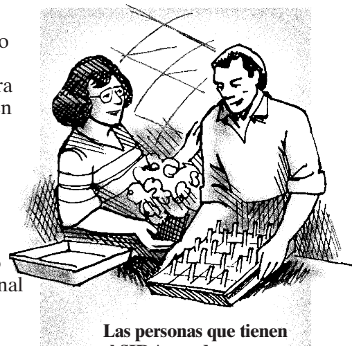
Las personas que tienen el SIDA pueden parecer sanas y no tener síntomas por años.